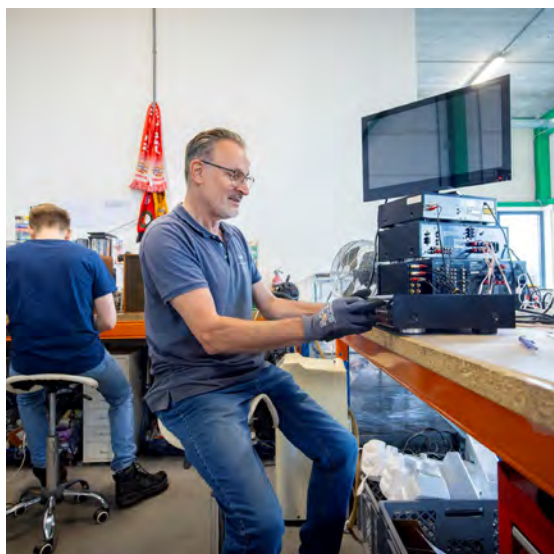
Foto's: Ecodorp Boekel, winnaar Kringlogo-prijs (links) en elektronicareparatie bij de Kringloper (rechts).