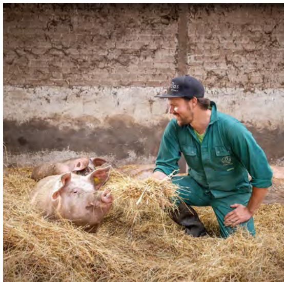
Foto's: Tomaten van Natuurlijk Henriette (links) en bij Boer Bas in de stal (rechts).