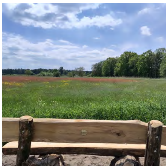
Foto's: bosanemoon (links) en bankje uitgereikt ter ere van de Casimir Milieuprijs (rechts).