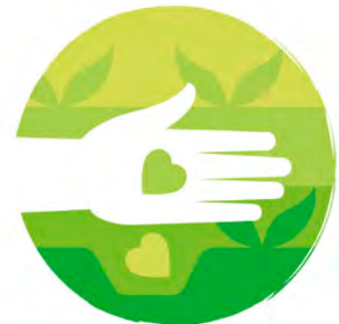
DUURZAME LANDBOUW & VOEDSELPRODUCTIE