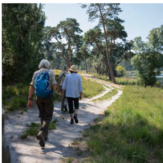
Foto's: BMF-lezing 2023 (links) en Waterwandeling in de Brabantse Wal (rechts).